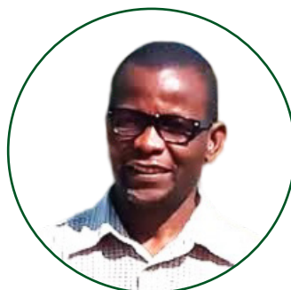
Dkt. Gimbage E. Mbeyale Mhadhiri Mwandamizi. Idara ya Usimamizi wa Misitu na Upimaji.