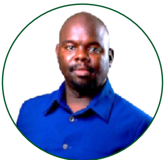
Dkt. Kadeghe G. Fue Mhadhiri Mwandamizi. Idara ya Uhandisi Kilimo.