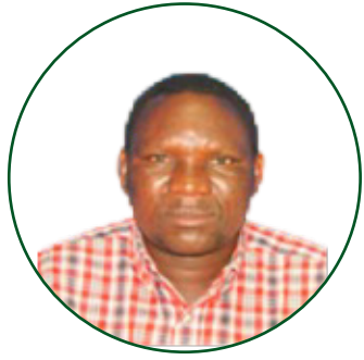
Dkt. Siwel Nyamba Mhadhiri Mwandamizi. Ndaki ya Kilimo.