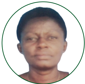
Dkt. Safiness S. Msollo Mhadhiri. Idara ya Lishe na Sayansi ya Mlaji.