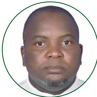
Dkt. Amani S. Kitegile Mhadhiri Mwandamizi. Idara ya Usimamizi wa Wanyamapori.