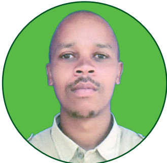
Babu J. Nyange Warden I. Kitengo cha Nyumba za Watumishi na Malazi ya Wanafunzi.