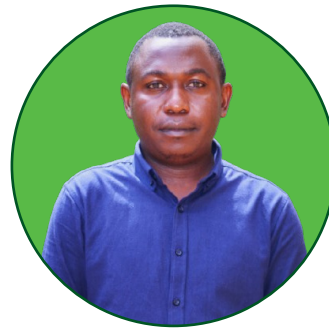
Mwinyi B. Masala Mwanasayansi Mwandamizi wa Maabara II. Idara ya Fiziolojia, Biokemia na Famakolojia.