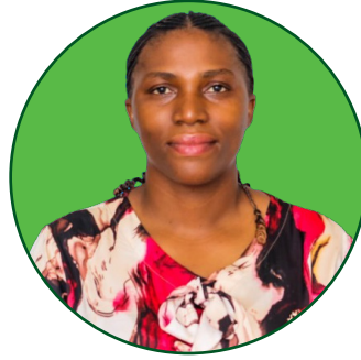
Dkt. Kajenje M. Nkukurah Mhadhiri. Idara ya Upimaji na Usimamizi wa Misit.