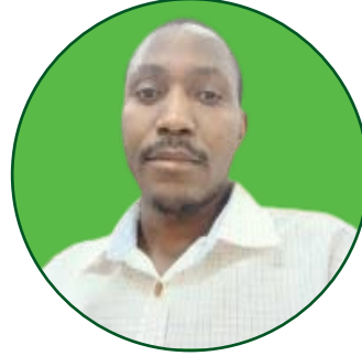
Neshafati A. Fwaya Mhadhiri Msaidizi. Idara ya Usimamizi na Uhifadhi wa Maliasili.