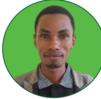
TleHEMA G. Umbayda Mhadhiri Msaidizi. Idara ya Sayansi ya Viumbehai.