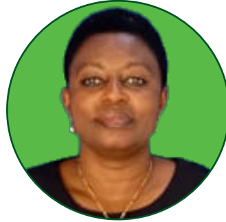
Dkt. Safiness S. Msollo Mhadhiri Mwandamizi. Idara ya Lishe na Sayansi ya Mlaji.