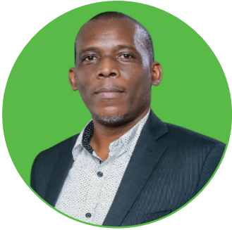
Kajura E. Magoma Afisa Rasilimali Watu na Utawala Mwandamizi II. Kurugenzi ya Menejimenti, ya Rasilimali Watu na Utawala.