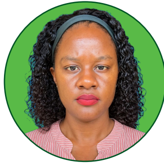
Glory Mella Mhadhiri Msaidizi. Idara ya Ugani Kilimo na Maendeleo ya Jamii.