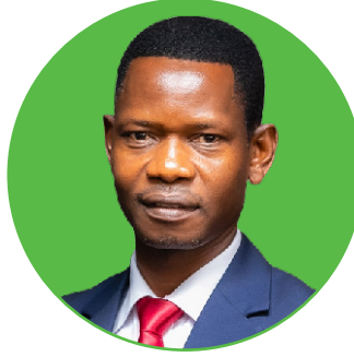
Dkt. Nkuba N. Mbeho Mhadhiri Mwandamizi. Ndaki ya Sayansi Asilia na Tumizi.